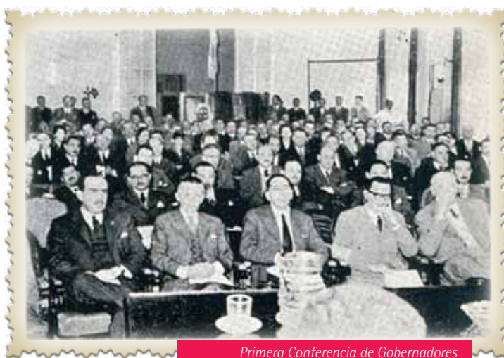
Primera Conferencia de Gobernadores