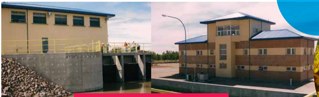
Acueducto La Pampa - Pichi Mahuida

Con un módulo de 149 \text{ m}^3/\text{s} , el río Colorado se encuentra actualmente regulado por la Presa Casa de Piedra, ubicada en su cuenca media. El embalse, con una longitud de 10,5 km, una superficie superior a 35.000 hectáreas y un volumen máximo de 3.600 \text{ hm}^3 , permite regar actualmente más de 150.000 hectáreas sobre un total de 320.000 que potencialmente se podrían regar con la regulación total del río, una vez construidas las presas necesarias para garantizar el aprovechamiento máximo de los recursos. En las superficies mencionadas, además de producción agrícola, existe también desarrollo ganadero.